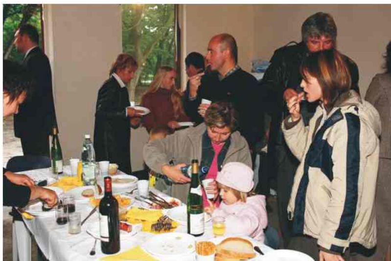
Przyjęcie w parku na Guberni.