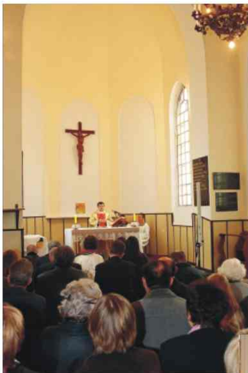
Msza Św. w intencji rodu Korwin Szlubowskich w kaplicy pw. Św. Anny na radzyńskim cmentarzu parafialnym (wszystkie zdjęcia pochodzą z uroczystości pt. "170 lat Korwin Szlubowskich w Radzynie Podlaskim", która odbyła się 2 X 2004 r.).