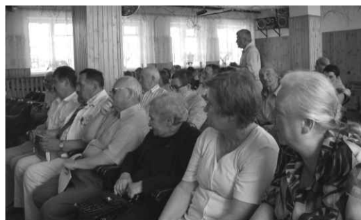
Konferencja spotkała się z żywym przyjęciem, zwłaszcza kombatantów i osób pamiętających powojenny okres sowietyzacji kraju.